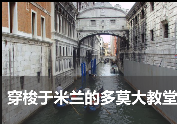
穿梭于米兰的多莫大教堂