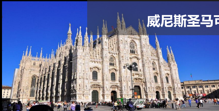
威尼斯圣马可广场与叹息桥